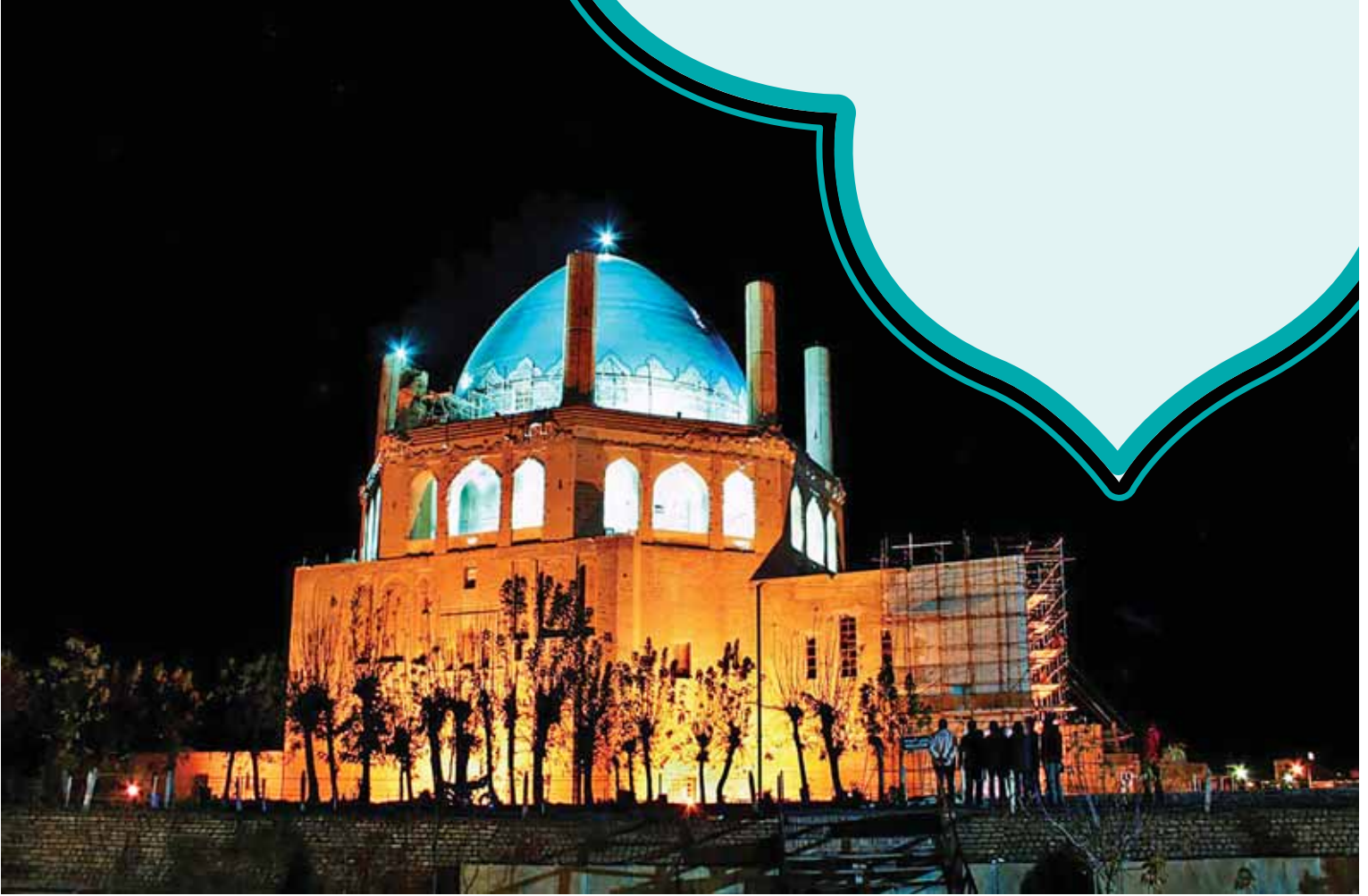
تصویر ۱. گنبد سلطانیه