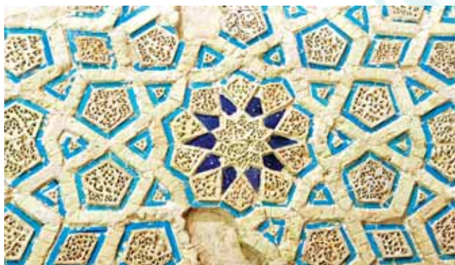
تصویر ۳. بخش‌هایی از تزئینات گنبد سلطانیه

گنبد سلطانیه با توجه به انگیزه ساخته شدن آن و سپس تغییر و تحولی که در به‌کارگیری بنا و تزئینات آن به وجود آمد، همچنان، بنایی